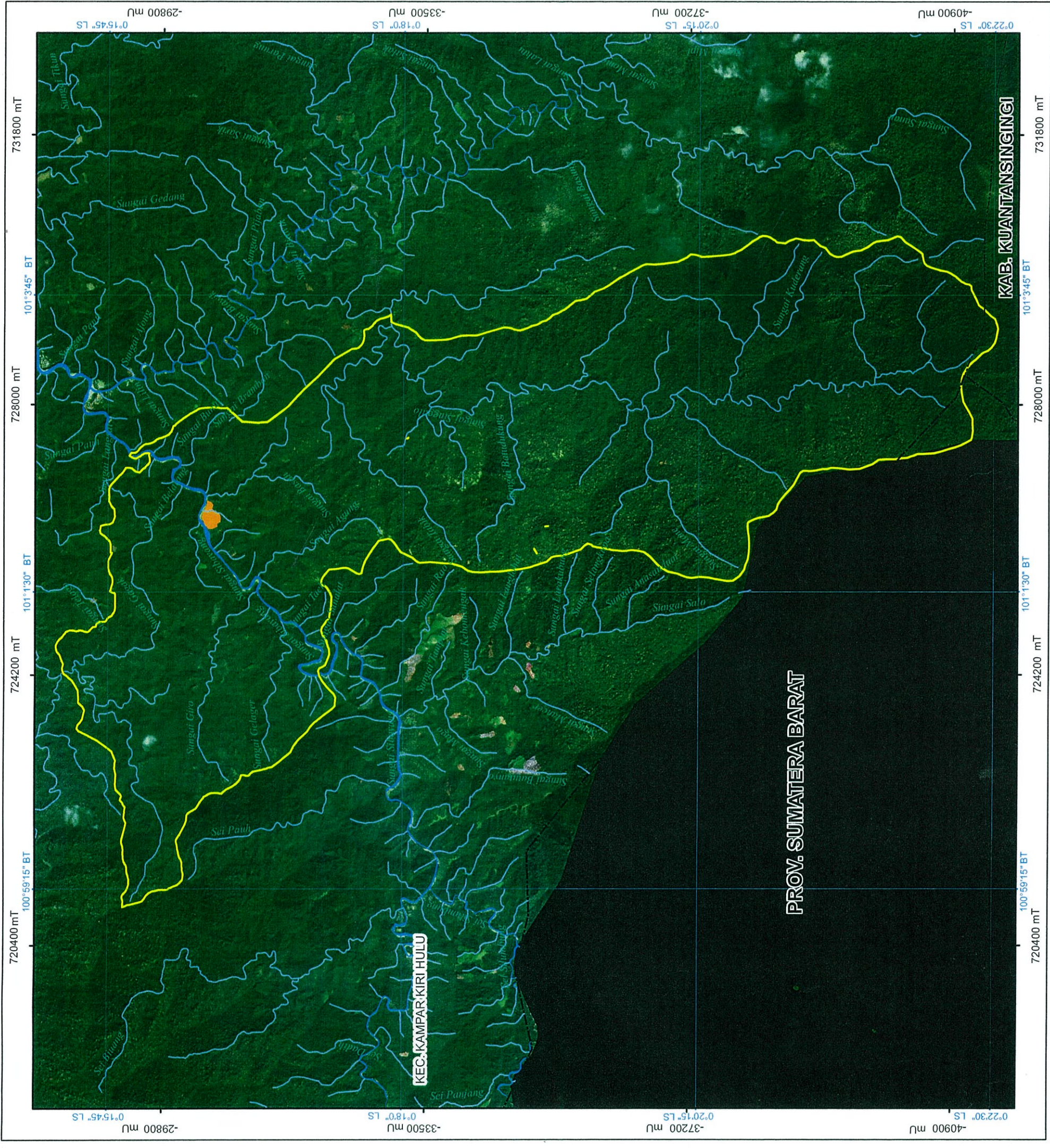
Peta Tanah Ulayat Adat Kenegerian Terusan Desa Terusan Kecamatan Kampar Kiri Hulu Kabupaten Kampar